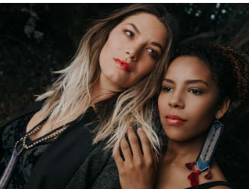
Lili Carrillo Joyería